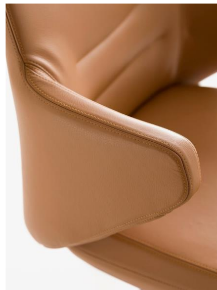
GUIA EXECUTIVE Chair Collection Designed by Favaretto and Partners